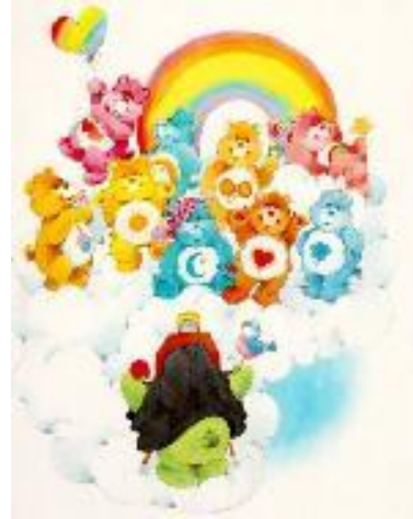
Toute ressemblance est purement fortuite

Pour finir en beauté, nous empruntons vers l'ouest la crête étroite menant jusqu'au pic de Taupe d'Ourse (1987m) que nous atteignons vers midi, l'heure du Ricard, n'est-ce pas Francis ?