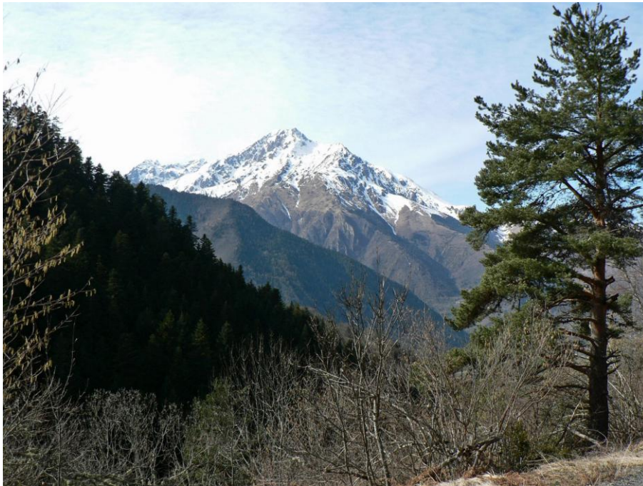
L'Arbizon dans toute sa splendeur

Après quelques montées et descentes, l'arrêt casse-croûte se fera à Peyres Aubes avec un magnifique panorama sur les sommets allant de l'Ariège au Néouvielle même plus.