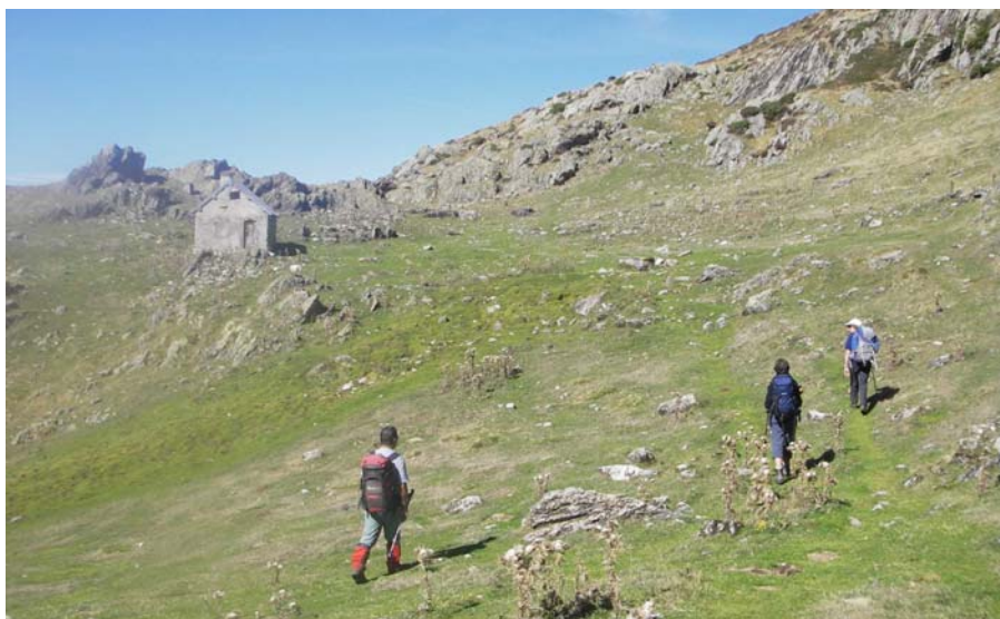
Cabane du Taus

De là un sentier suit la courbe de niveau à 1950m jusqu'à la cabane du Taus.