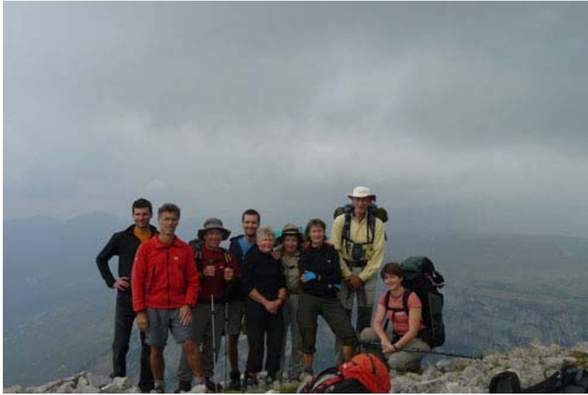
photo de famille du

sommet du premier des Sestrales. Ca commençait tout de même à tirer un peu dans les pattes. Mais la vue vertigineuse ver le fond du cañon justifiait bien ce petit effort. Après avoir regarder en l'air , puis à l'horizontale , maintenant on regarde en bas.