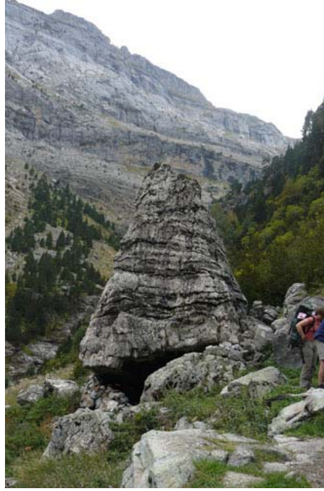
Nos logements !!