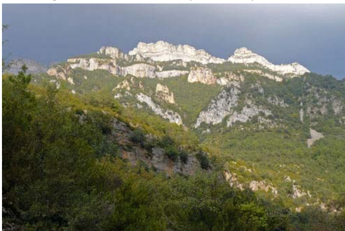
lumière d'orage sur les Sestrales.

Et on continue par une descente sous des buis , que même un sanglier aurait eu du mal à passer.. il est fada ce Pierre , putin ils nous y reprendra pas , ça c'est sûr. !!! Le reste de la descente est vraiment bien long. Il faut que le chemin trouve son chemin entre falaise et à-pics , 'et c'est pas de la tarte je vous le dis !! Zig et zag , il aura fallu bien 4h pour descendre du sommet jusqu'aux voitures, om l'orage nous cueille 10 mn après avoir posé les sacs..