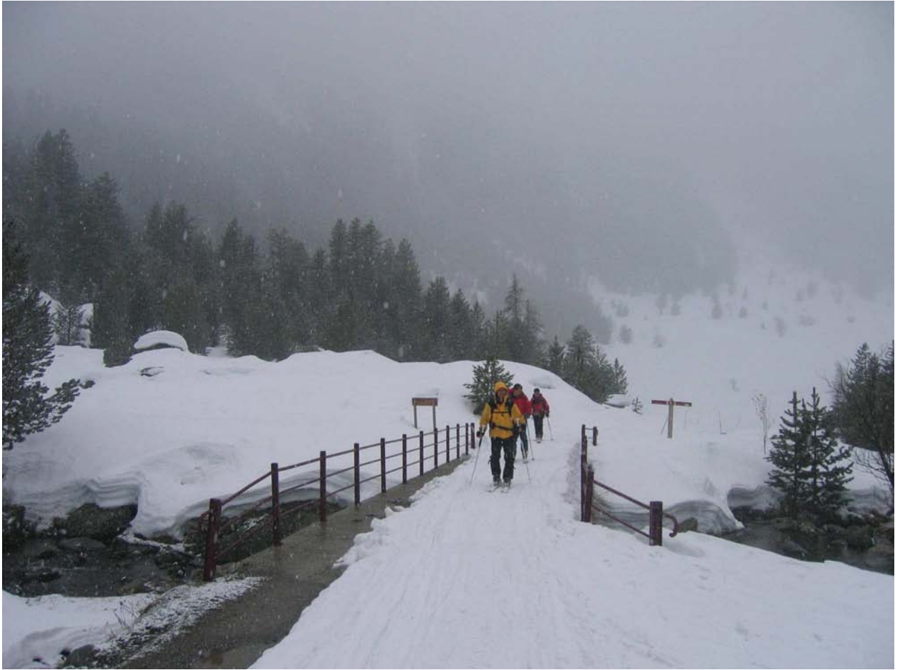
Vers 13H30 on voit le refuge ...