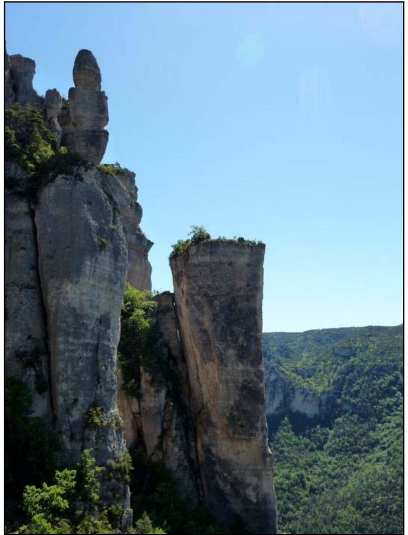
Fabrice au départ de la 2ème longueur ... sisi