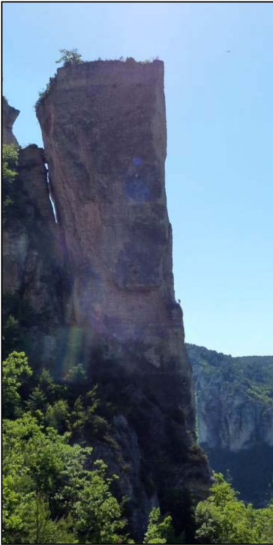
Fabrice au milieu de la 1er longueur