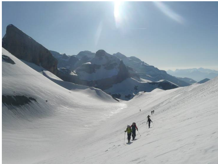
Remontée vers cols SO du Taillon. Pte Bazillac, Casque, Mont-Perdu...