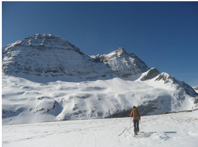
Francis au col de Tentes, face N du Taillon