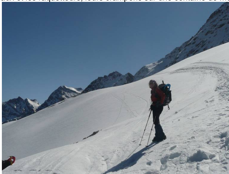
Emilie après la traversée

Les skieurs mettent les couteaux et les raquetteurs, leurs crampons sur une centaine de mètres.