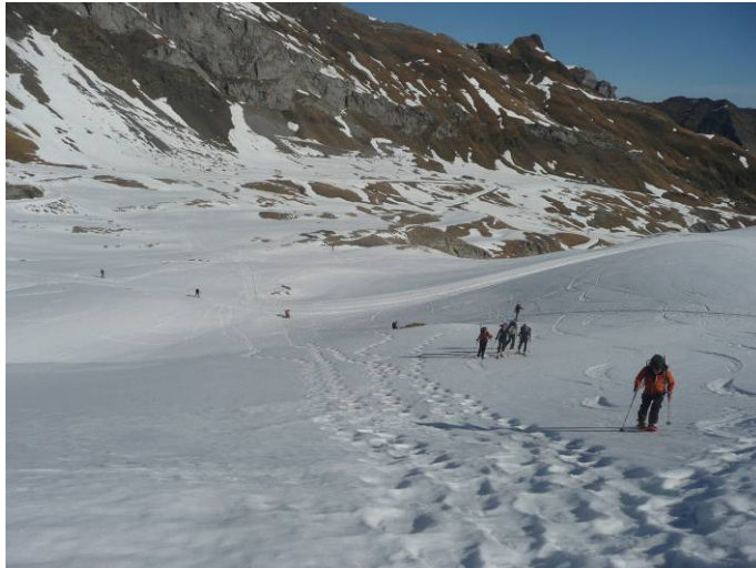
Montée vers le col de Tentes par la station fermée. Raquettes + skis