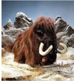
Montée à la Brèche de nos amis les raquetteurs

Un beau WE s'annonce : météo au beau fixe, ouverture du refuge de la Brèche la veille , 2 équipes à l'assaut d'un sommet facile. Oui des raquetteurs se sont immiscés dans cette sortie au risque de nous gâcher les traces « avec leurs traces de mammoths...)