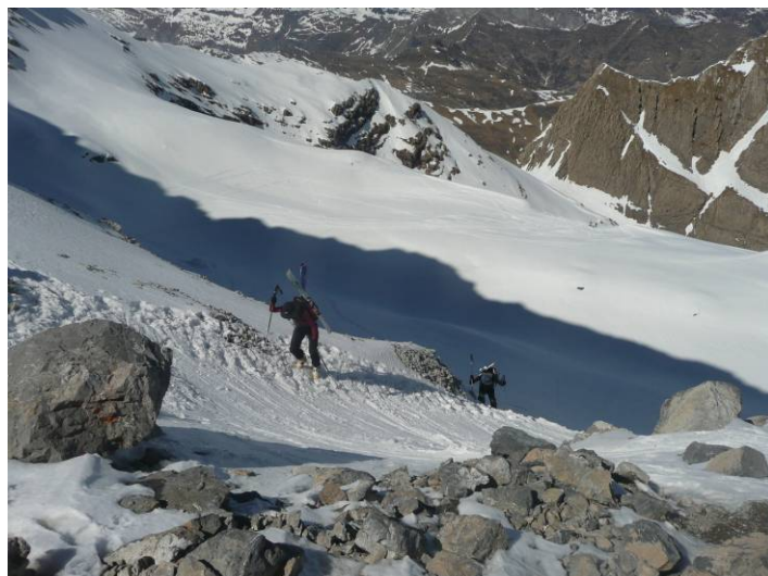
La montée à la Brèche, raide sur les 20 derniers mètres

L'après-midi, nous montons à la Brèche. Certains remonteront plusieurs fois de suite que ce soit pour profiter de cet endroit magique, pour s'amuser dans la descente ou pour s'entraîner pour Chamonix-Zermatt !