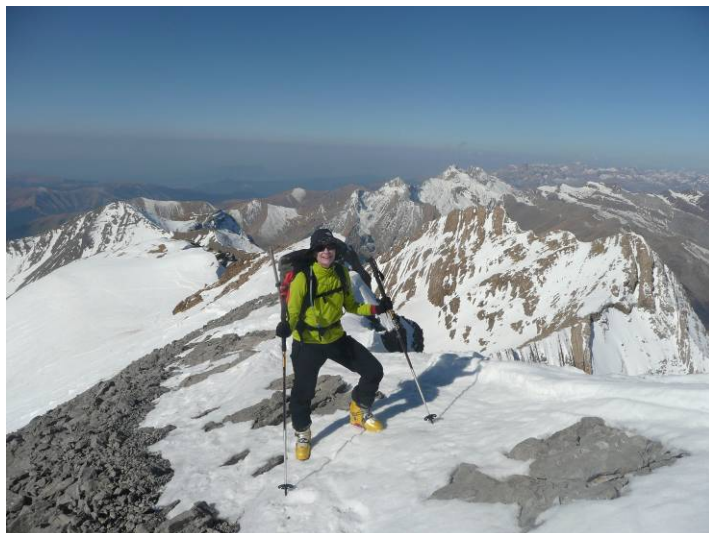
Remontée de l'arête SO du Taillon

Il manque un peu de neige pour arriver skis aux pieds au sommet.