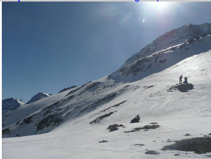
Après le Port, c'est verglacé

Les skieurs mettent les couteaux et les raquetteurs, leurs crampons sur une centaine de mètres.