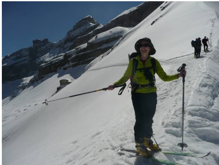
Cam au col des Sarradets, le refuge en vue, ainsi que le Casque et la Tour