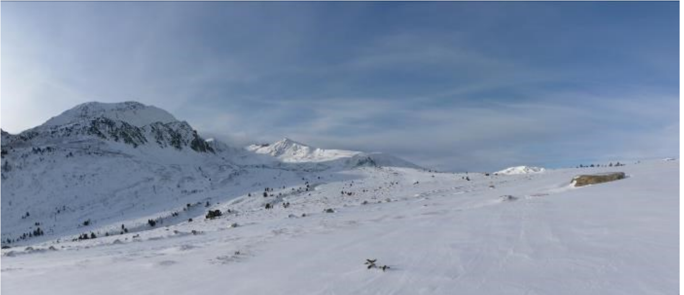
Le Pic de la Mine au fond de la station de Porté-Puymorens

Il n'y a pas de vrais novices dans le groupe, tout le monde a déjà pratiqué le ski de randonnée. Le beau temps et l'absence de danger spécifique permet de faire un briefing succinct pour le départ. Depuis le parking, on voit la destination et quasiment toute la route qui y mène. Un exercice de recherche DVA sera fait plus tard dans la journée. Pour le départ, tous se contentent de passer un par un devant Francis pour vérifier que l'appareil émet bien son signal puis chacun part à son rythme sur une neige dure mais qui couvre bien les cailloux.