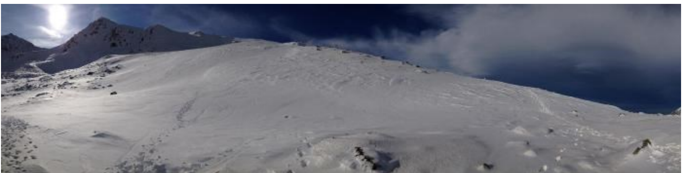
Traces de descente