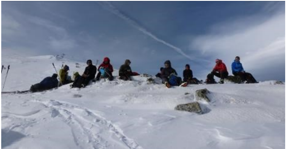
Bonnets et doudounes de rigueur pour le pique-nique