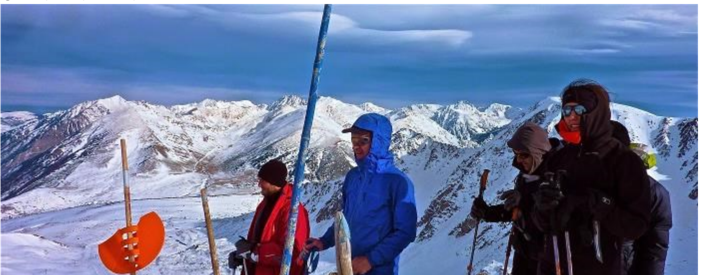
Le col du Puymorens vu du Pic de la Mine

contourné, au sud, les pics de la Valette et de Front Negra, au sud-ouest, le pic dels Pedrons. Les appareils photos sortent des sacs et remplissent les mémoires d'images et de souvenirs.