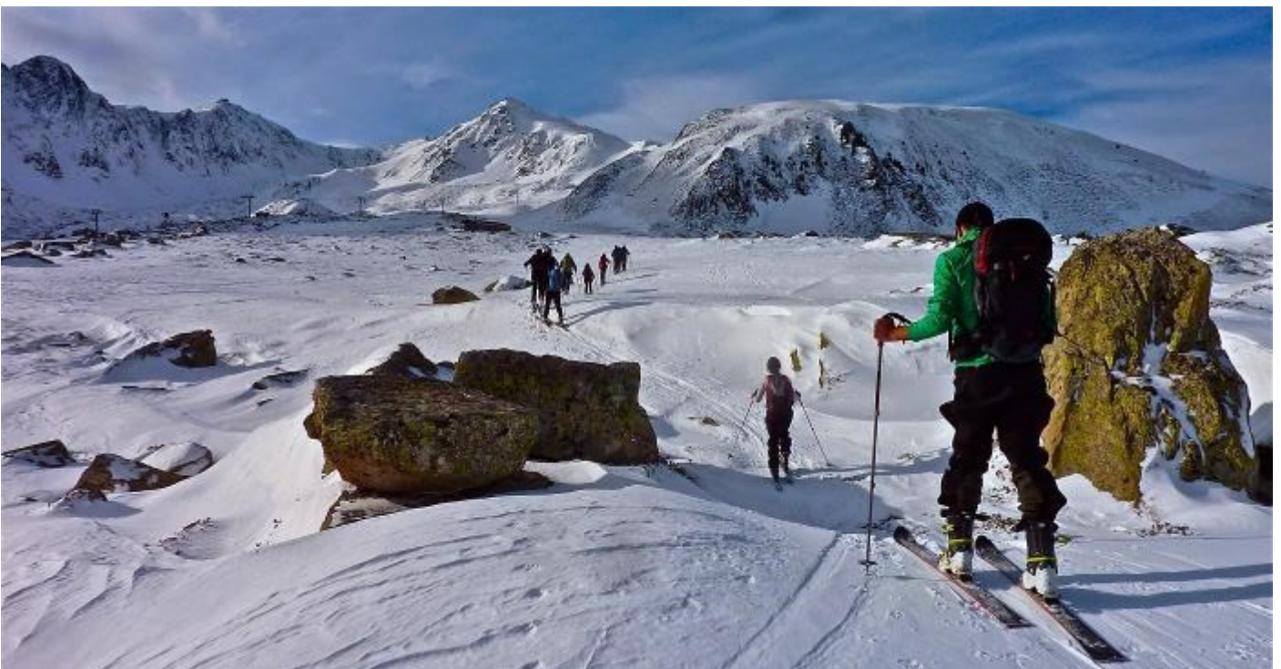
Neige et rochers

Les premiers atteignent l'extrémité protégée de la station de Porté-Puymorens et l'on sent déjà la neige chassée des crêtes par le vent. Bientôt, un peu plus haut il faudra penser à ressortir veste, coupe-vent et polaire pour faire face à la bise qui cingle et