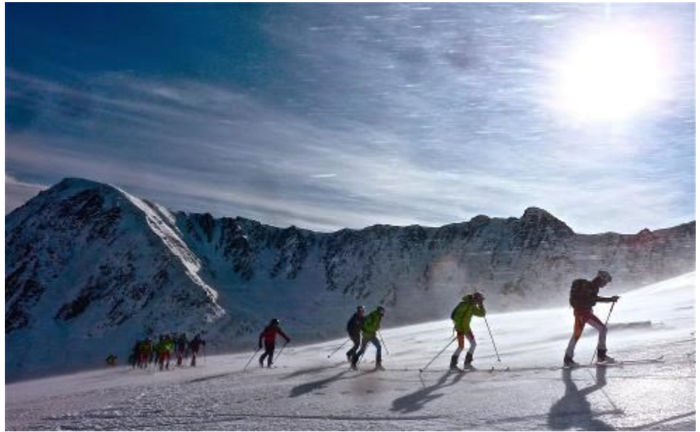
Group in wind

Francis attend les derniers, motive, encourage et finalement tout le monde arrive à un petit replat où l'on peut poser les skis pour gravir à pied la petite cinquantaine de