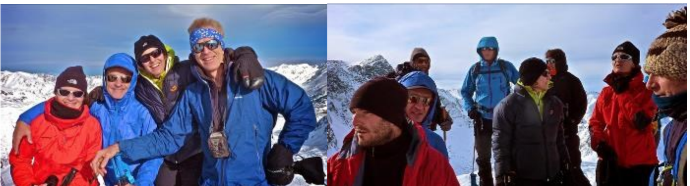
La joie du sommet