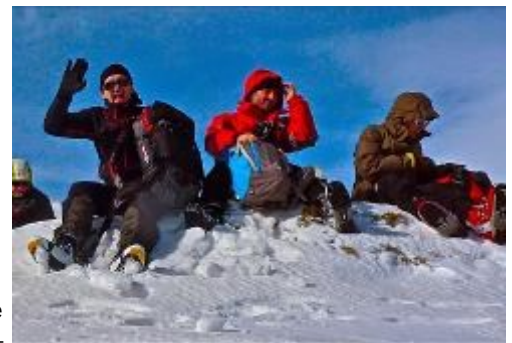
Bonne humeur malgré la bise!

Tout le monde se retrouve pour un dernier arrêt à Ax les Thermes pour se réchauffer. C'est l'occasion d'exprimer son plaisir de