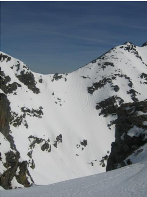
Col du Trou de l'Ours

A 13h00, on se décide pour la descente même si la meringue sommitale est toujours gelée, mais dès que la pente s'accroît, ça devient très bon avec quelques cm de neige fondue.