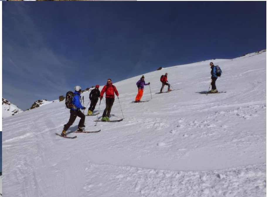
Début de la descente