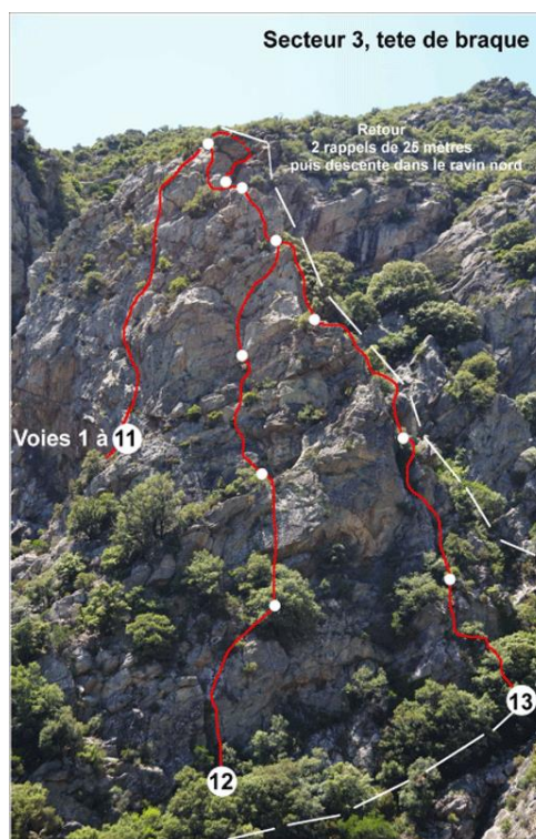
# 13 : Arête Sud

Après cette mise en bouche, on se prépare à la journée du lendemain