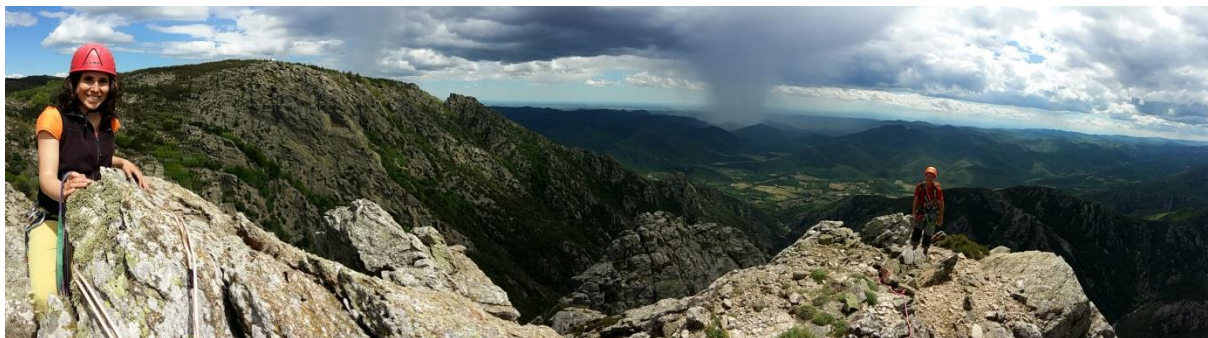
Au sommet de l'Aiguille : l'orage est passé à côté de nous...