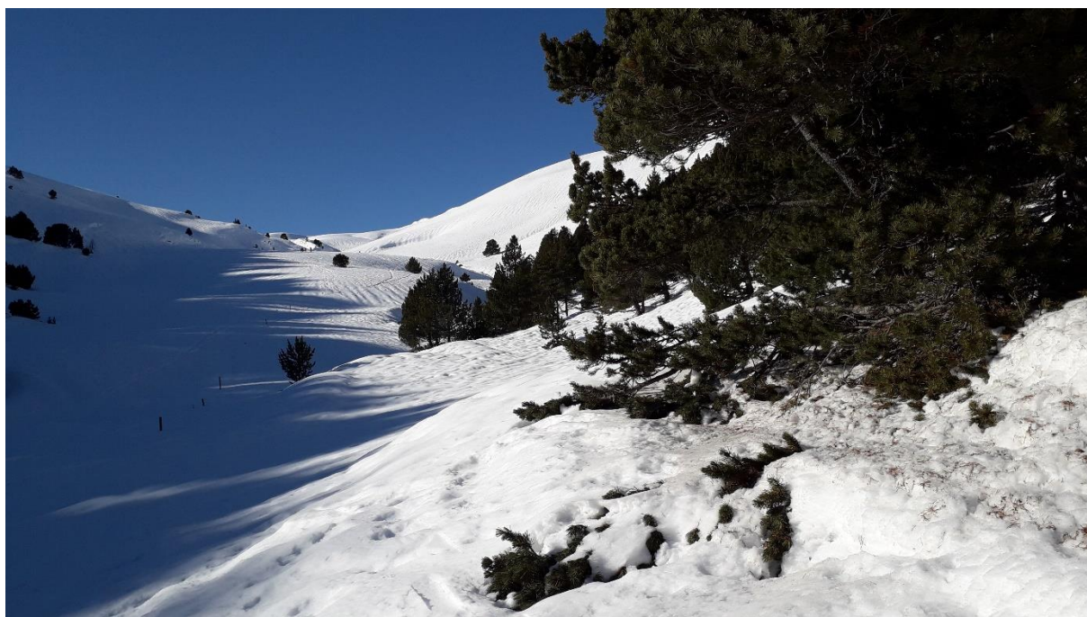
Vallon de descente du Cap de Closos

Domage qu'il y ait un petit vent car nous aurions bien apprécié de manger au sommet. Descente par le vallon habituel de montée jusqu'à 2200 m, un poil trop tôt mais les pentes sont quand même presque transformées donc c'est du bon ski.