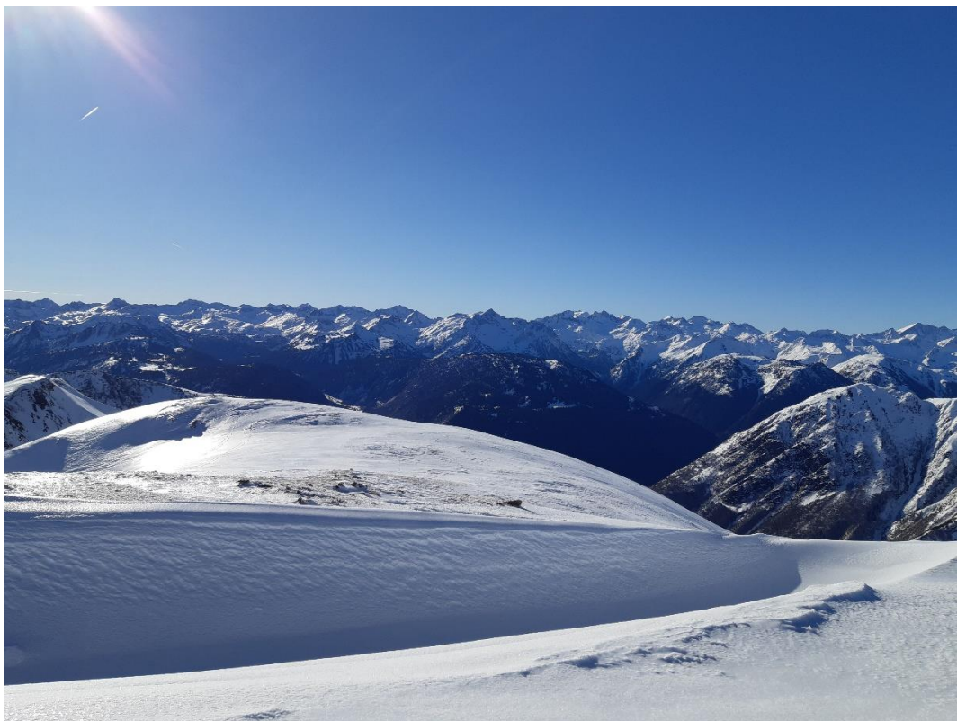
Vue sur l'Aneto-Maladeta depuis le Cap de Closos

De là, nous continuons jusqu'au Cap de Closos : la neige est très dure en raison de la pluie et du vent, ce qui nous oblige à mettre les couteaux pour le dernier ressaut : paysage immense et splendide des Encantats au massif de l'Aneto.