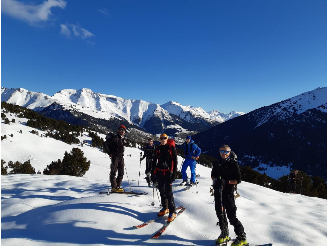
Sortis de la « forêt », vue sur le Barlonguere-Valier au fond

De là, nous continuons jusqu'au Cap de Closos : la neige est très dure en raison de la pluie et du vent, ce qui nous oblige à mettre les couteaux pour le dernier ressaut : paysage immense et splendide des Encantats au massif de l'Aneto.