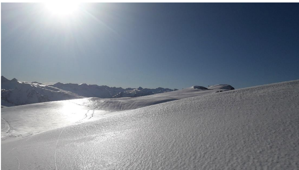
Vue sur les Encantats en route vers le Closos