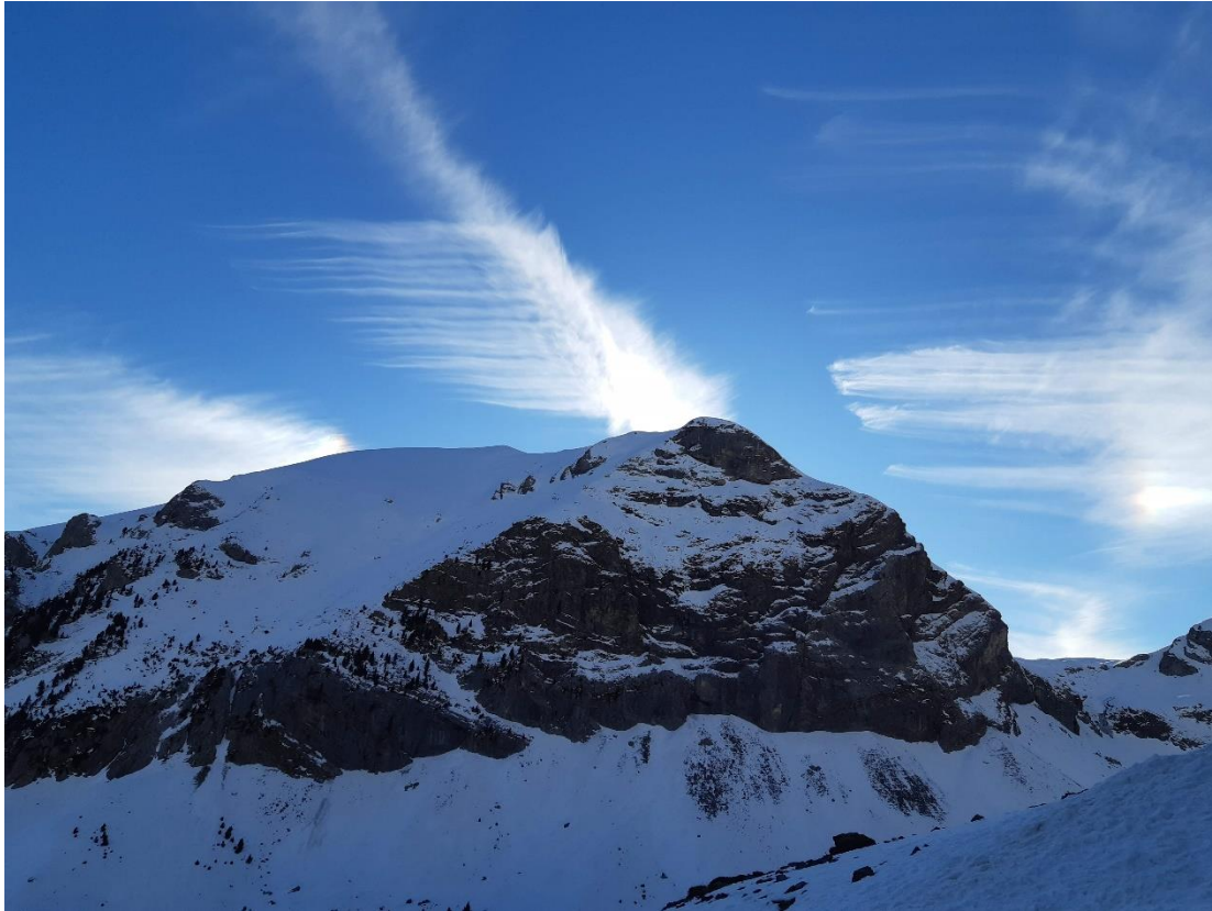
« Dernier rayon de soleil »

Bien qu'étant versant espagnol, cette course est aussi bien enneigée sinon mieux que « les classiques du tunnel » et est très accessible et sécurisante à descente de par son exposition.