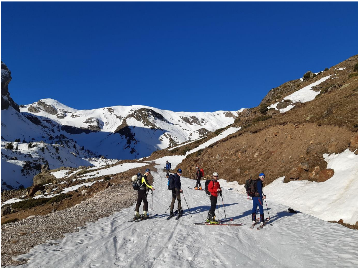
« Piste de Chisagues vers les mines de Parzan »

Départ 6h30 TOAC, nous passons le tunnel de Bielsa vers 9h00. Des groupes s'affairent sur le parking, mais sans skis. L'enneigement est très médiocre. Nous poursuivons vers l'Espagne jusqu'à Chisagues et remontons la longue piste VTT jusqu'au parking à 1700m.