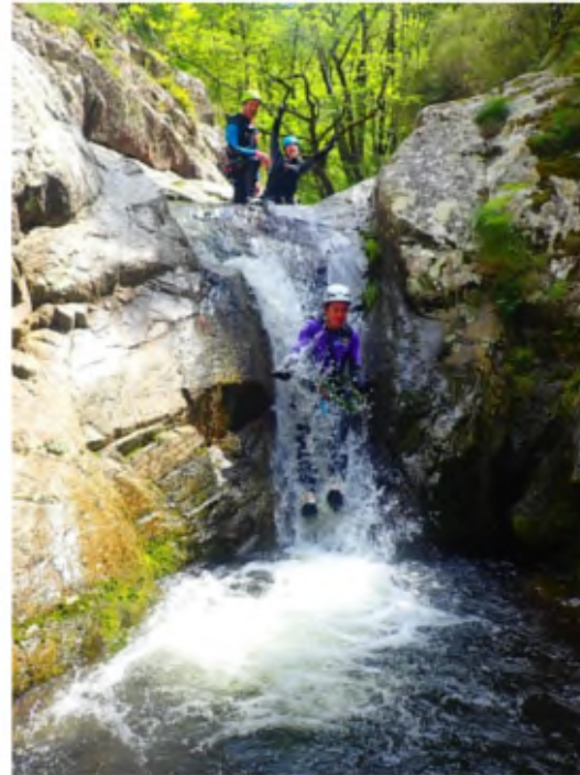
Audrey dans la faille et toboggan