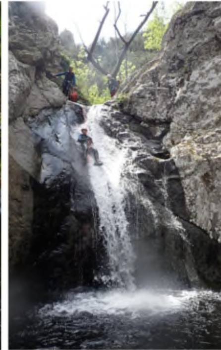
Florian dans toboggan vertical et en gestion de frottement