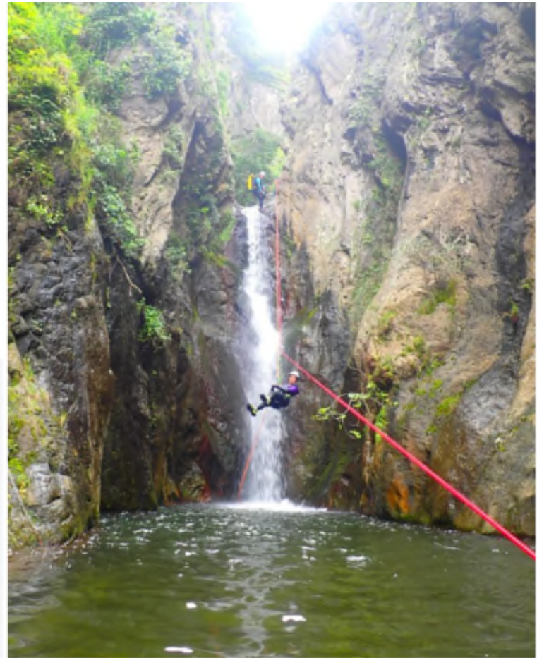
Audrey en action