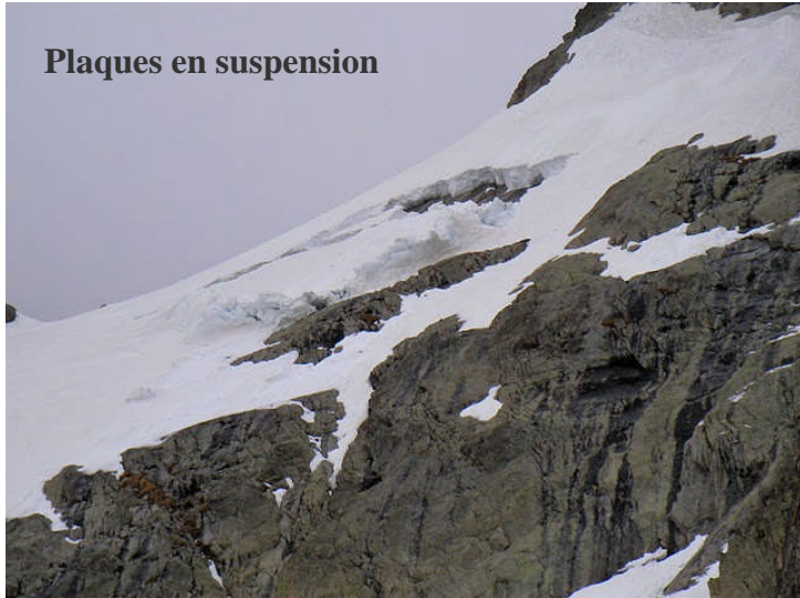
Plaques en suspension