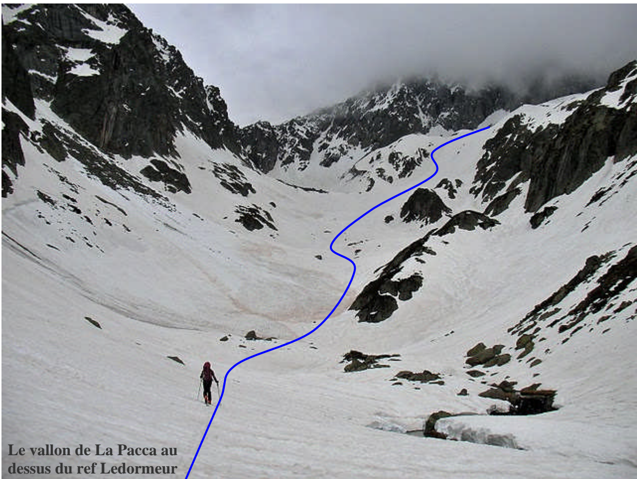
Le vallon de La Pacca au dessus du ref Ledormeur

Départ matinal vers le massif pour éviter les bouchons de la rocade. La météo n'annonce rien de beau pour les 4 jours sur l'ensemble de la chaîne des Pyrénées. On improvisera donc à la journée. 10h et skis sur le sac, tennis aux pieds pour mes collègues, nous montons vers le lac Suyen, délaissions le vallon de Larribet pour poursuivre la route jusqu'au refuge Ledormeur. Les skis sont chaussés à 1950m. La sortie du ce jour, longe le vallon de la Pacca, traverse le col du Pabat et redescend sur le refuge D+1200m. Ceci me permettant d'observer les conditions et l'enneigement parfait de la cheminée de Las Néous, objectif du 4ème jour.