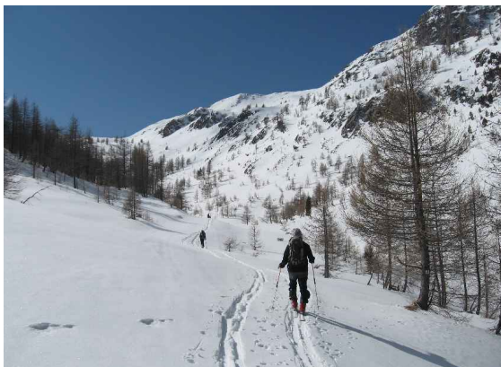
En montant à Furfande

Pas de problème d'enneigement, pour ce sommet de 2744m qui était au programme. Nous partons plein nord pour rejoindre le col de Furfande à 2500m, puis le sommet par les crêtes. Très belle course avec une montée dans la forêt de mélèzes. Nous descendons directement depuis le petit col sous le sommet, c'est la meilleure descente de la semaine, 5 cm de poudre sur une sous-couche dure, ça tourne avec les oreilles.