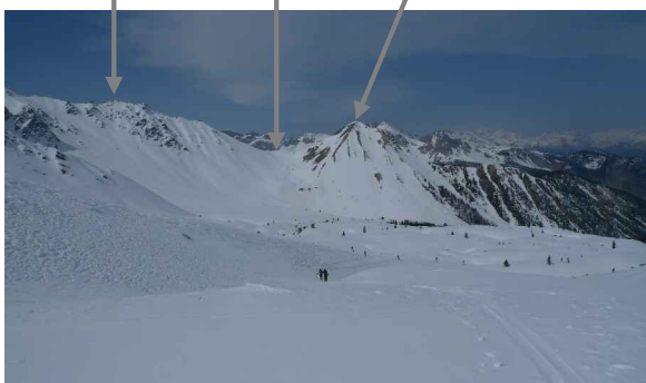
Côte Belle Col Perdu l'Arpelin