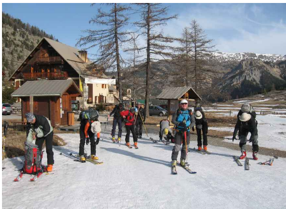
Le chalet Hôtel de l'Arpelin à Le Laus