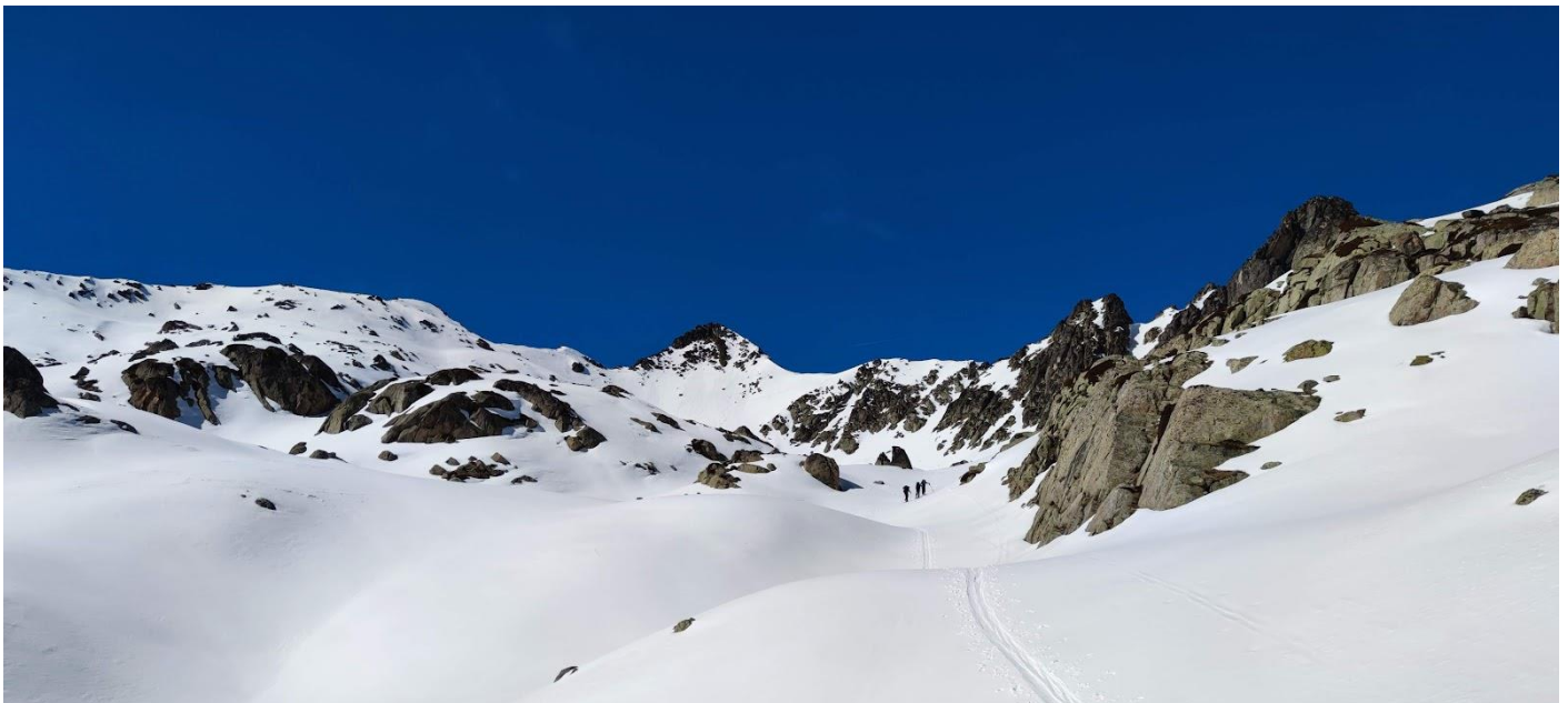
Vue sur le pic des Quatre Termes et le col éponyme

Une petite pause débriefing à Bagnères et nous serons de retour à Toulouse avant le couché du soleil.