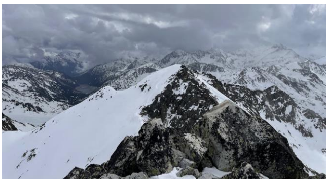
Pic du Contadé depuis les Quatre Termes

Nous partons vers 10h00 du parking, les pistes sont rapidement quittées et nous entrons dans une ambiance plus haute montagne. La météo, annoncée pluvieuse, tient bon, nous avons même le droit à quelques éclaircies. Du col, le sommet du Pic des Quatre Termes étant proche et tentant, nous décidons d'y aller, on chausse les crampons et nous filons au sommet.