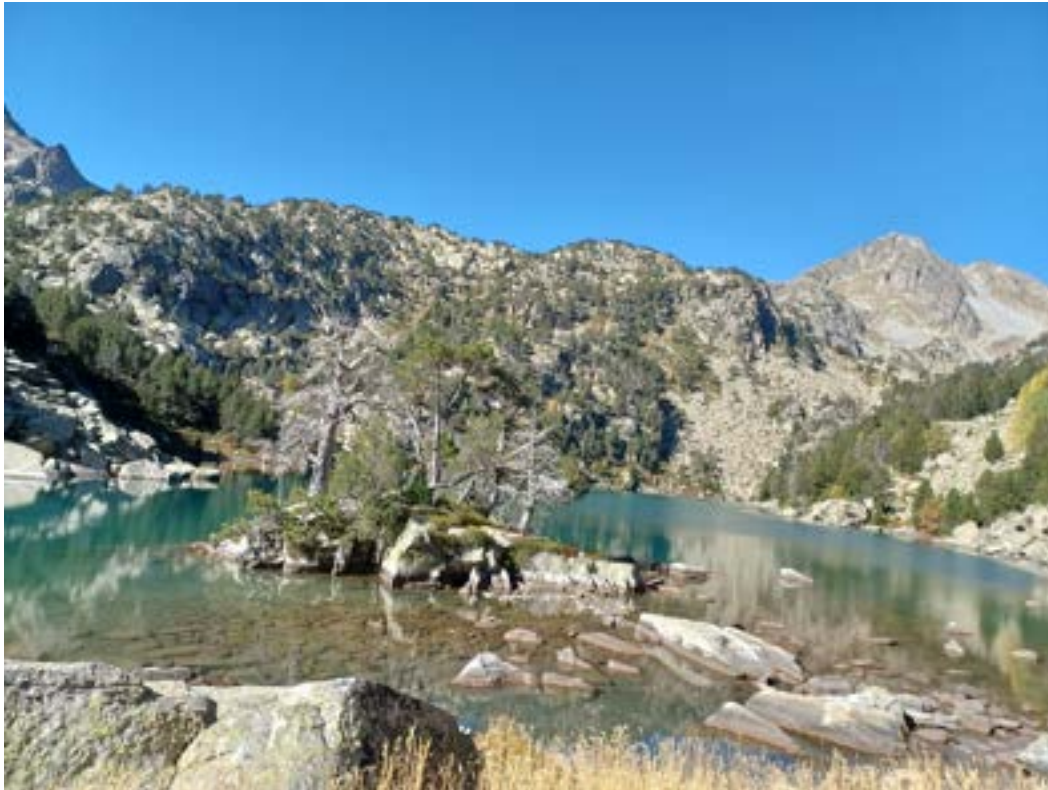
Estany Negre de Cabanes

Les choses commencent à se gêter car il faut contourner le lac par la gauche, jusqu'à un petit vallon, à travers un chaos de blocs escarpés et plein de trous. Prudence de rigueur, l'adhérence des semelles est mise à rude épreuve. Le paysage est toujours aussi magnifique mais il faut s'arrêter pour regarder.