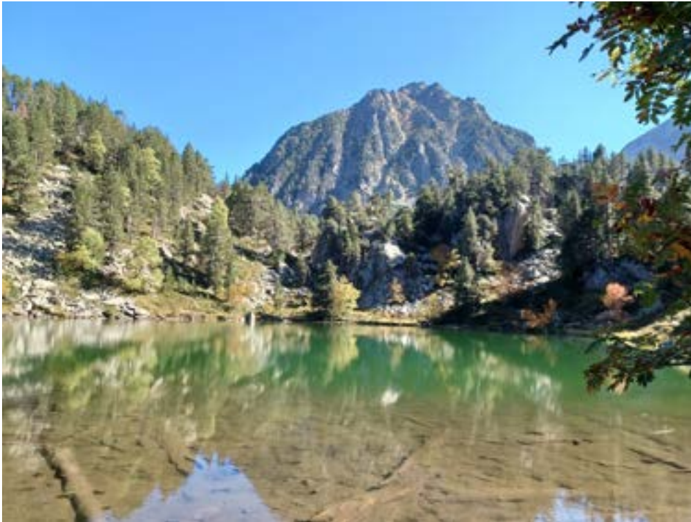
estanyola de Gerber

On descend sur un chemin bien tracé avec encore de belles surprises, des truites actives dans l'Estany petit, qui trahissent leur présence avec les ombres sur le fond et les gobages à la surface et puis le dernier laquet, estanyola de Gerber, paysage de carte postale.