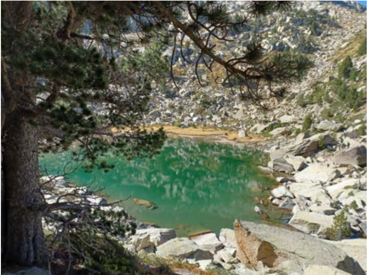
Clots de Cabanes

à l'entrée du petit vallon, dernier coup d'oeil au lac et on grimpe le long du petit filet d'eau, rio de los Abadies. Arrêt à l'ombre au dernier laquet du clos de Cabanes avant la Coma éponyme qui grimpe à 90° vers le col de Bassiero