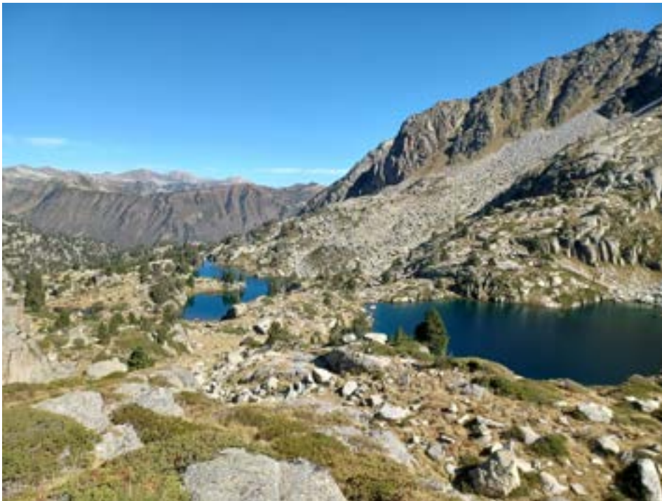
Estany Redo et Llong

la descente loin d'être fastidieuse nous fait découvrir de nouveaux lacs: estany Redo, estany long et le lac de Gerber petite mer intérieure bordé de pins odorants