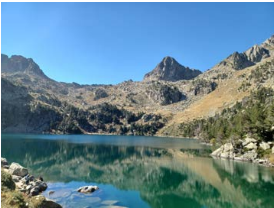
lac de Gerber