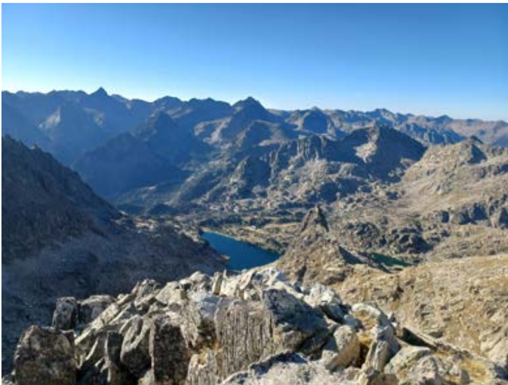
Lac d'Amitges et refuge au sud