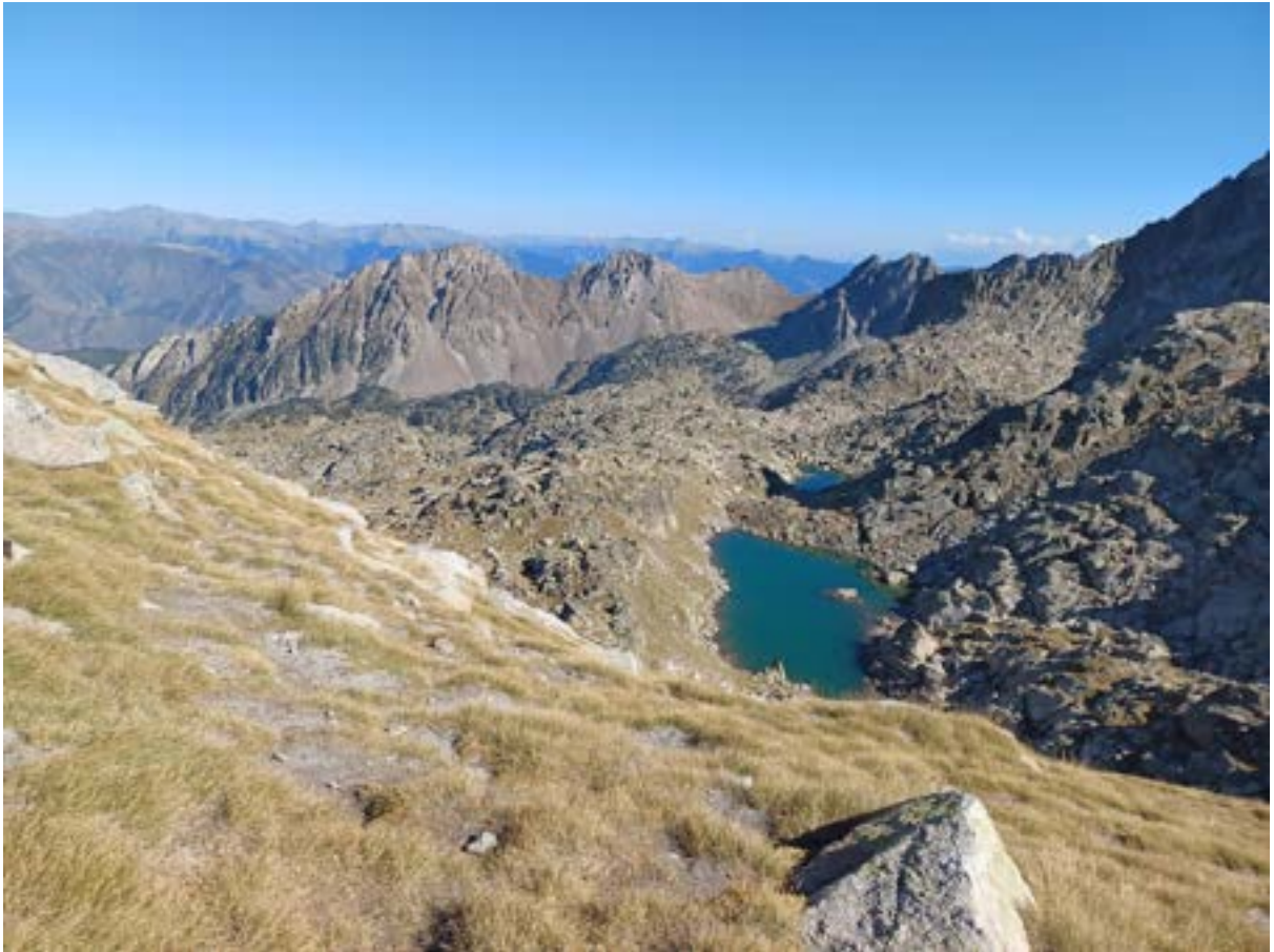
Vue des laquettes depuis le col de Bassiero