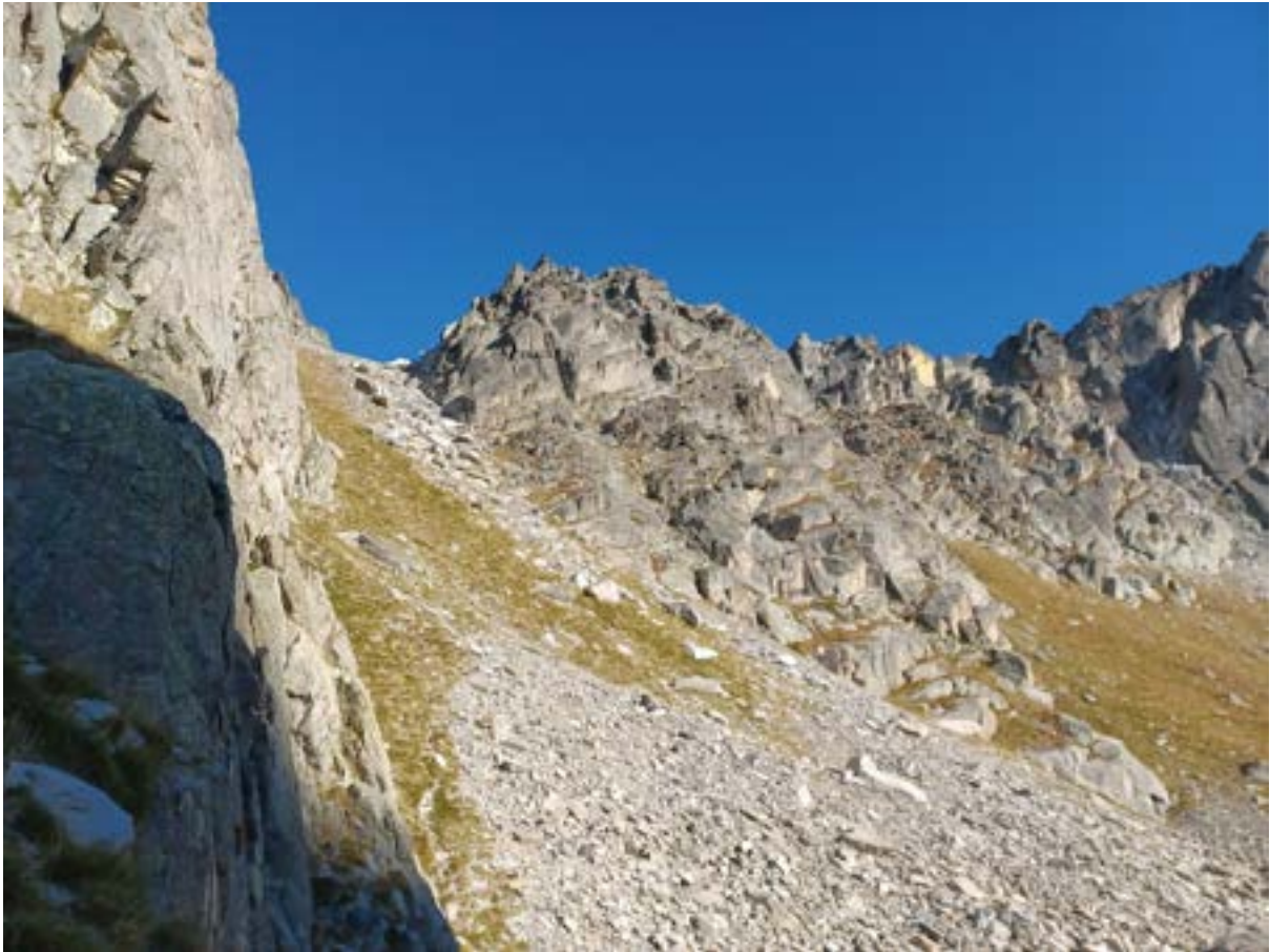
Col de Bassiero versant Gerber

En se rapprochant vers Mataro, on entend des “ola !”, “echo !”. Nous ne serons pas seuls, plus on descend et plus on voit de silhouettes autour du refuge.