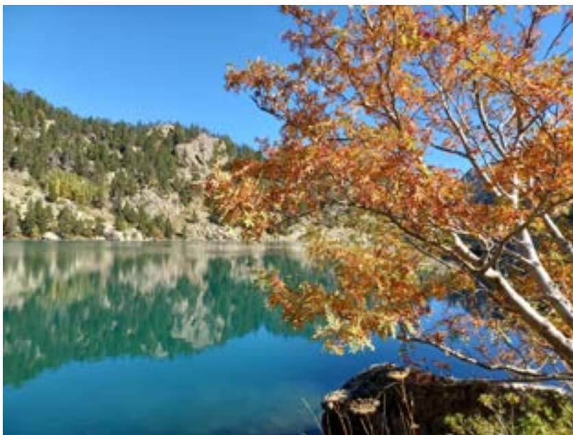
Estany Negre de Cabanes

Les choses commencent à se gêter car il faut contourner le lac par la gauche, jusqu'à un petit vallon, à travers un chaos de blocs escarpés et plein de trous. Prudence de rigueur, l'adhérence des semelles est mise à rude épreuve. Le paysage est toujours aussi magnifique mais il faut s'arrêter pour regarder.