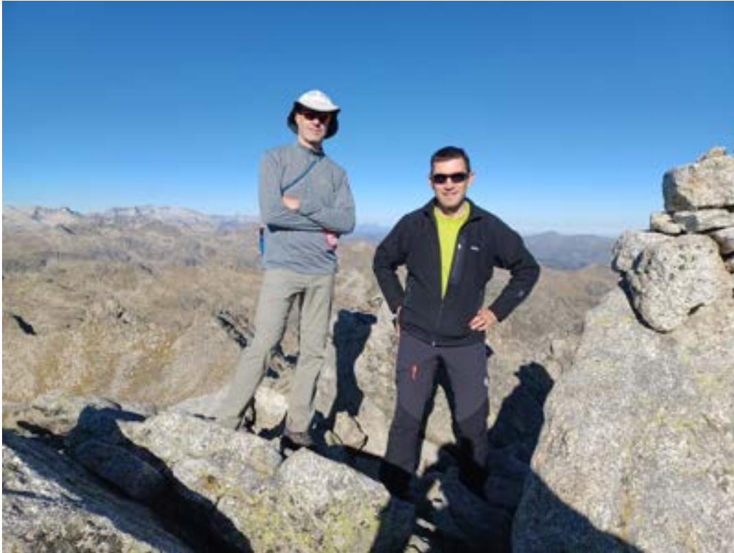
Pic d'Amitges, vue sur la Maladetta

On continue en crête vers le pic d'Amitges, là encore le passage hivernal pour rejoindre le col est un peu tendu mais en été c'est tranquille.