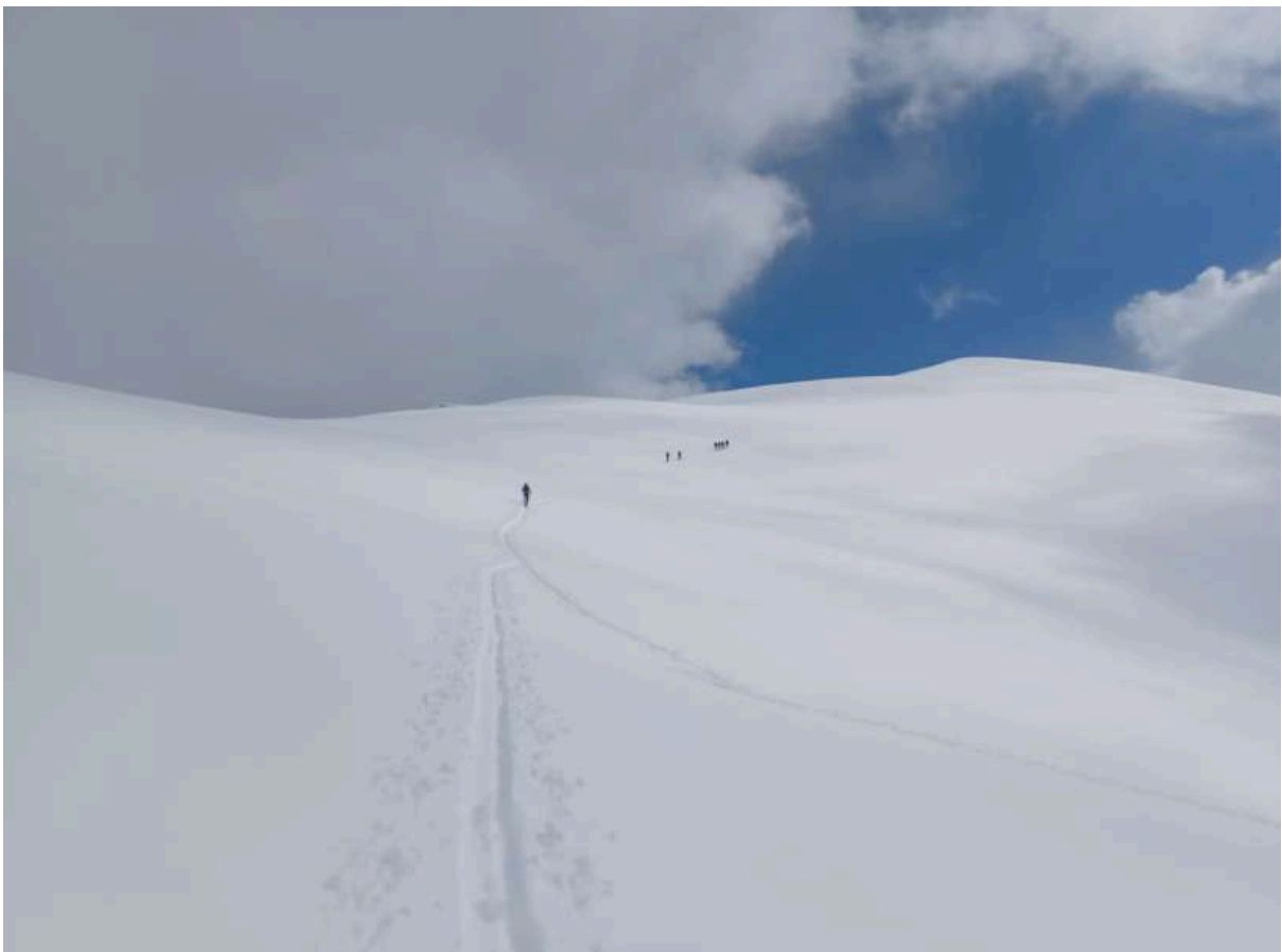
Montée au sommet de l'Aigle

Nous remontons au col du Lion pour basculer sur le versant Cazeaux et direction le fond de vallon pour aller vers le sommet de l'Aigle où quelques belles traces au soleil attirent notre attention.