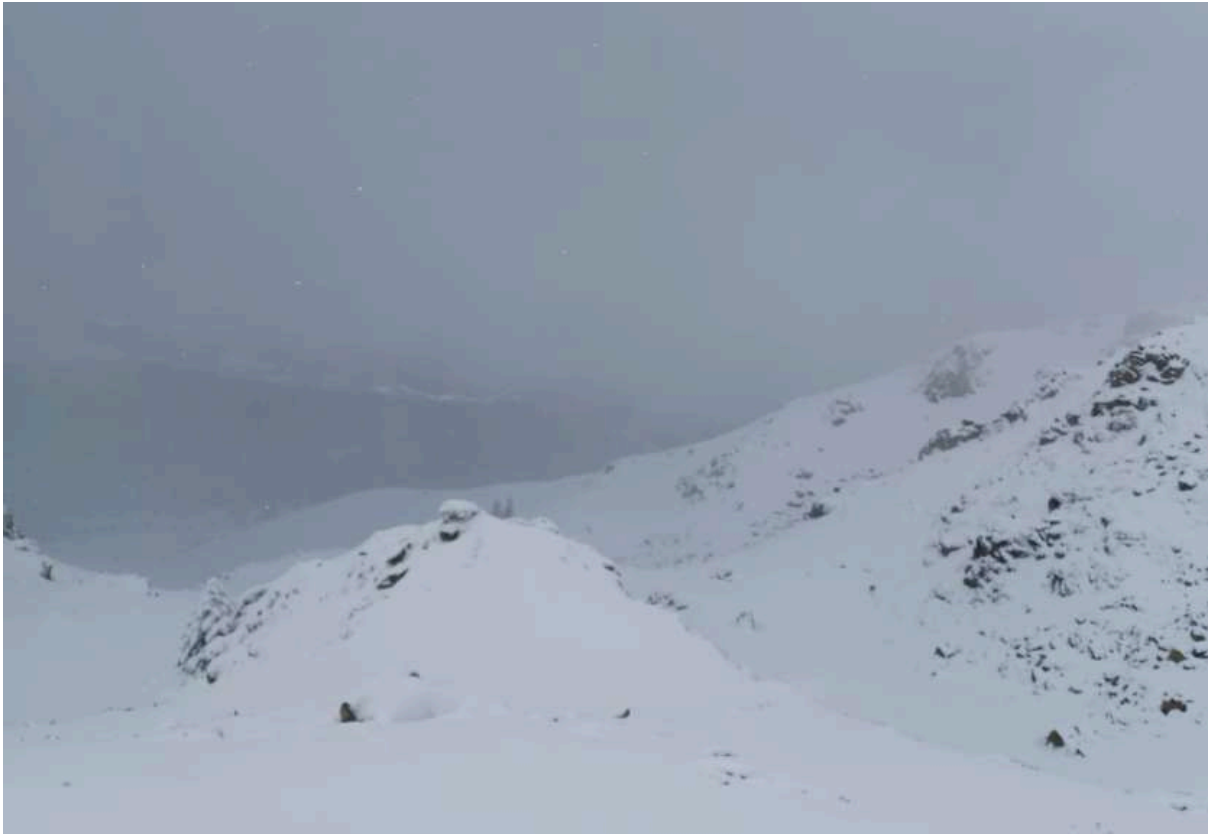
En montant au col du Jambet

On retrouve un peu de visibilité pour la descente convoitée versant Est, neige extra 30cm sur fond dur, pas de plaque. On s'espace malgré tout et on reste organisé jusqu'au lac de Bareilles partiellement dégelé, pas le moment de tenter la traversée.