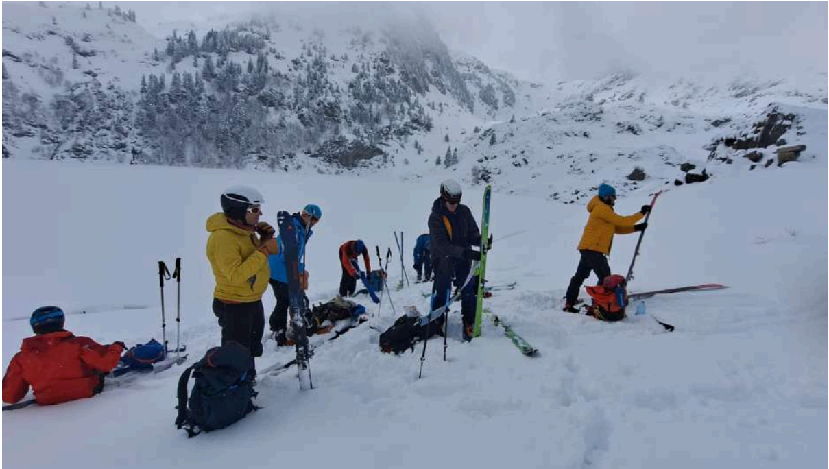
Lac de Bareilles

Nous remontons au col du Lion pour basculer sur le versant Cazeaux et direction le fond de vallon pour aller vers le sommet de l'Aigle où quelques belles traces au soleil attirent notre attention.