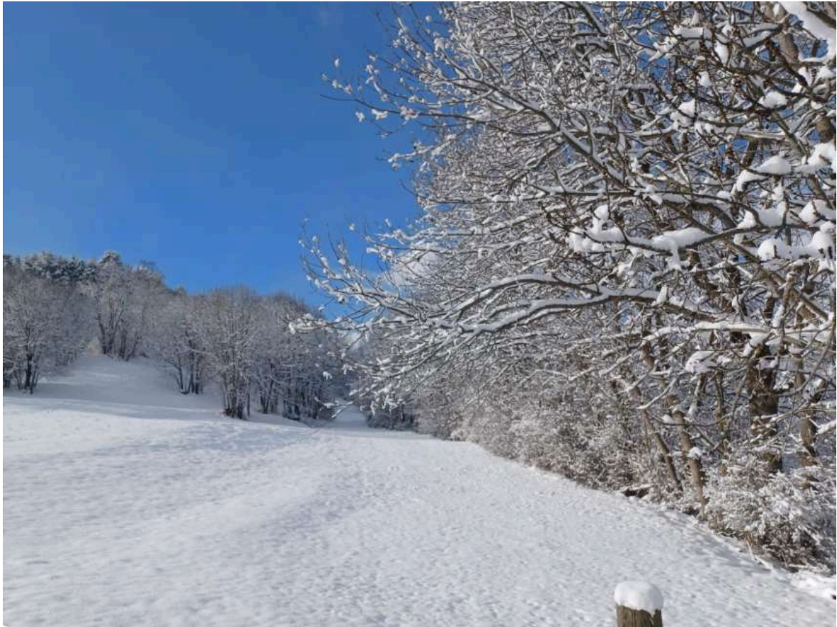
Piste de Balencous

La forêt a repris sa parure hivernale, les pentes du Jambet bien que recouvertes sont assez peu enneigées mais c'est herbeux donc ça passe bien.