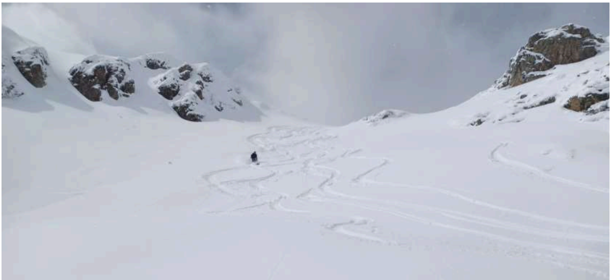
Descente vers le lac de Bareilles

On retrouve un peu de visibilité pour la descente convoitée versant Est, neige extra 30cm sur fond dur, pas de plaque. On s'espace malgré tout et on reste organisé jusqu'au lac de Bareilles partiellement dégelé, pas le moment de tenter la traversée.