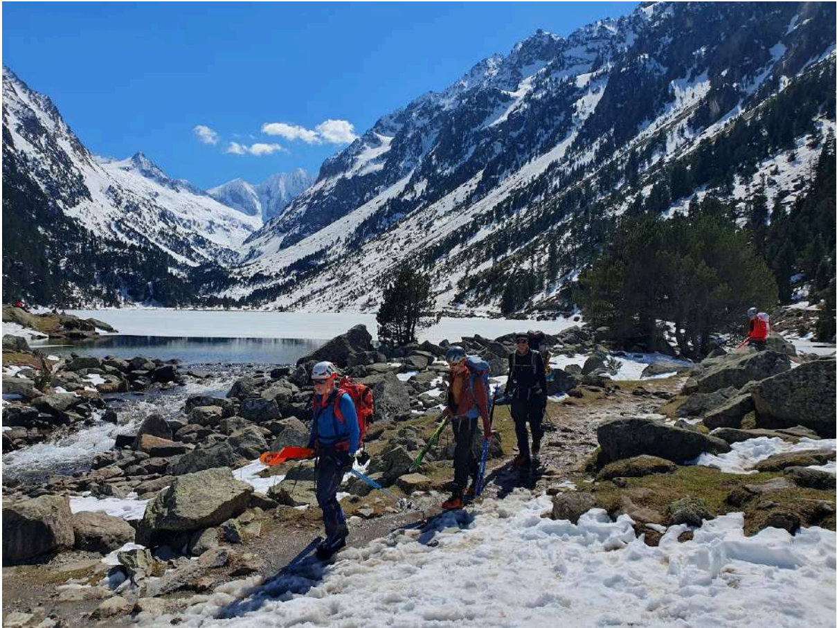
arrivés au lac de Gaube

il faut déjà penser à rentrer, est ce que le pari de descendre à skis sera tenu, sachant que l'an dernier nous avons portés les skis après la passerelle vers 2000 m. Descente quasi continue jusqu'au lac et sur les berges, tantôt en mode descente, tantôt en mode ski de fond.