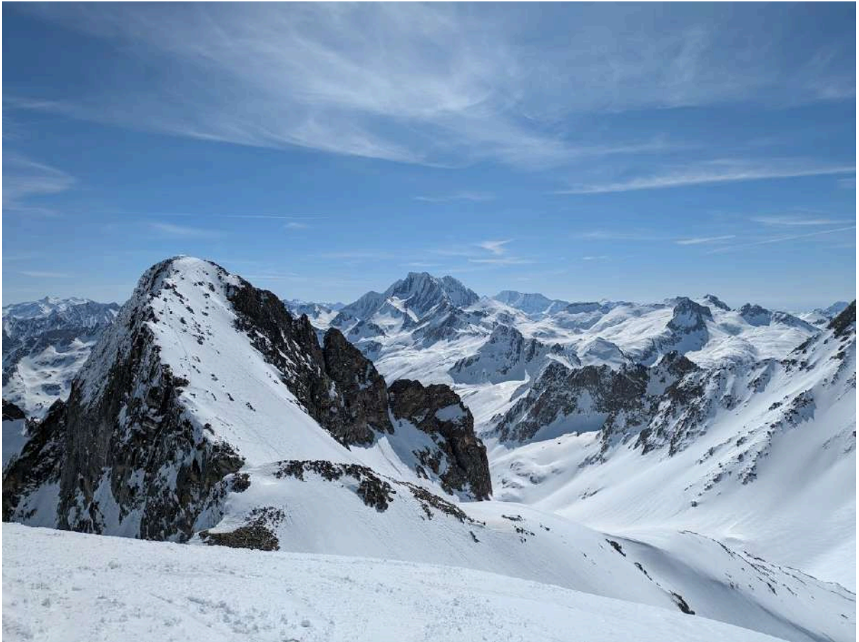
Vue sur la Petite Fache, le massif du Vignemale et la vallée du Marcadau