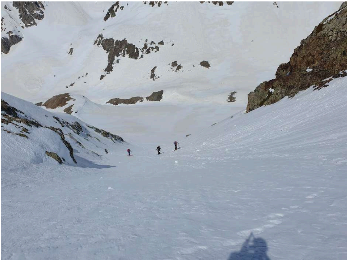
Petit mur du col des Oulettes

Nous remontons sous la chaleur vers le col d'Aratille pour contourner le rio et prendre pied sur le petit mur du col des Oulettes,