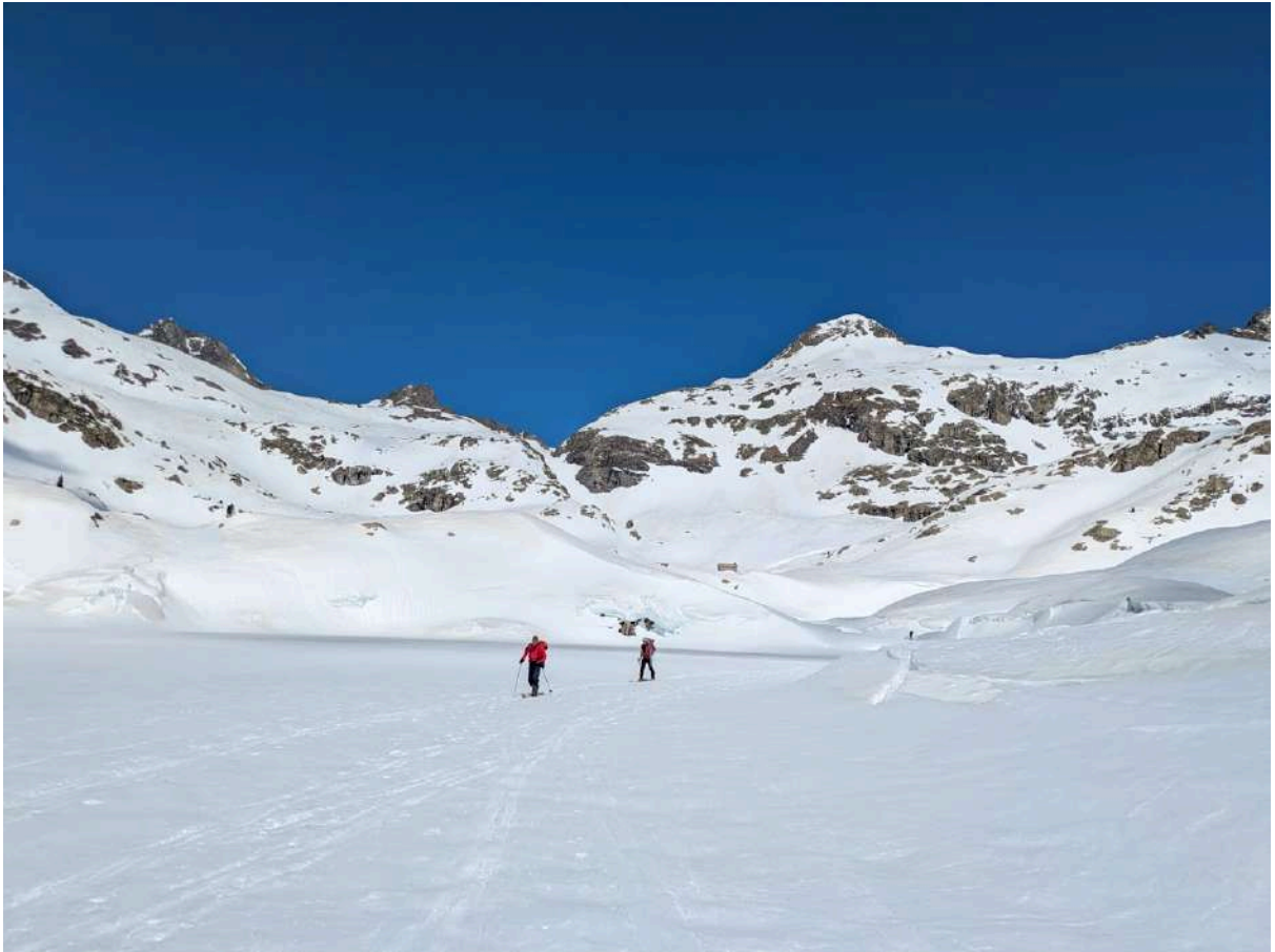
Traversée des lacs, au fond le couloir du Canal Fonda