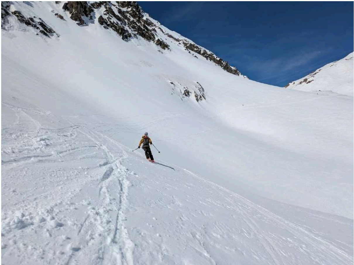
Longue traversée descendante en étant espacé entre les deux cols

Reste 200m, puis descente plein sud dans le canal Fonda, sans passer par les contre pentes à l'Ouest, c'est l'avantage du fort enneigement, tous le canyon est bouché jusqu'au lac. Nous traversons les immenses lacs dont le niveau a baissé et qui ressemblent à des glaciers avec les structures de neige écroulées.