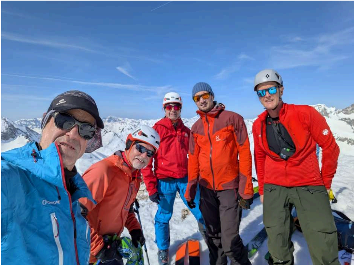
Team au Pene d'Aragon

Descente douce et soutenue sur une neige moquette, tip top, puis on enchaîne la traversée sous la Fache jusqu'au petit lac avant de repeauter pour le col du Marcadau, sous un soleil de plomb.