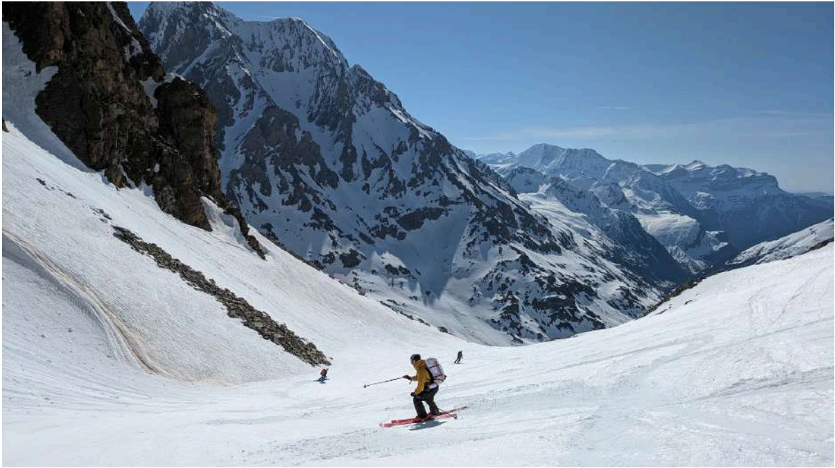
Début de descente vers le mur du col Letrero

Nous remontons sous la chaleur vers le col d'Aratille pour contourner le rio et prendre pied sur le petit mur du col des Oulettes,